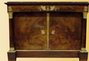
Commode Empire attribuée à JACOB-DESMALTER. 10 850 €