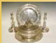
D'un ensemble d'argenterie PUIFORCAT. 14 100 €