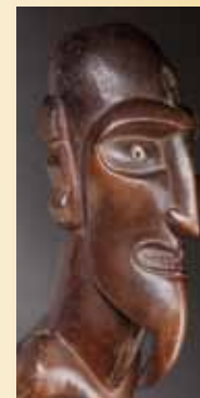
Statue masculine «Moi Tangata», Ile de Pâques. 19 060 €