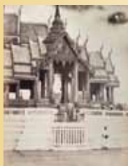
Album photo du roi du Siam RAMA IV. XIX e s. 13 700 €