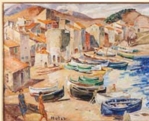
Mela MUTER (1876-1967) : Collioure, le port d'Avall et le Faubourg . HST. 63 140 €