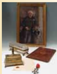
Souvenirs historiques du château de Valencay. 16 380 €