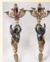
Paire d'appliques en bronze d'après Claude GALLE. XX e s. 9 500 €