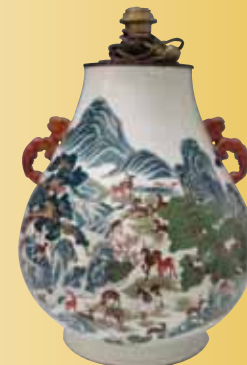
Vase aux cent daims. Marque apocryphe de Qianlong. Chine, XX e s. 21 680 €