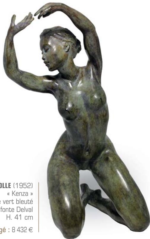
Marie-Paule DEVILLE-CHABROLLE (1952) « Kenza » bronze à patine vert bleuté signé et numéroté 4/8, fonte Delval H. 41 cm