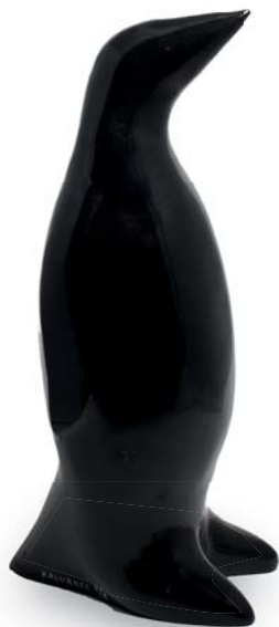
« Le pingouin » Xavier ALVAREZ (1949)

Bronze à patine noire signé et numéroté 4/8 H. : 52 cm Estimation : 1 500 / 2 000 €