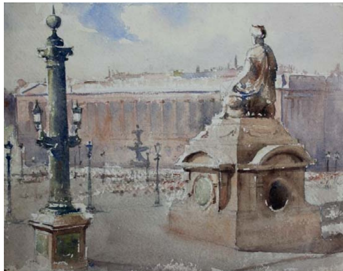
« La place de la Concorde »