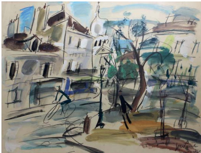
GEN PAUL (1895-1975) « Montmartre » circa 1925 aquarelle et gouache sur papier signée et située en bas à droite 51 x 65 cm