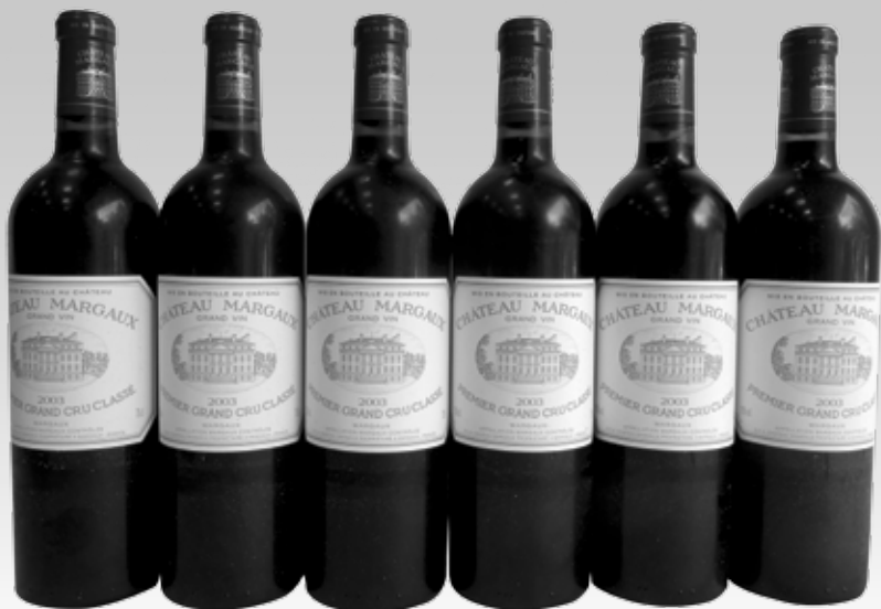
Lot 93 (6 BOUTEILLES CHÂTEAU MARGAUX 2003)