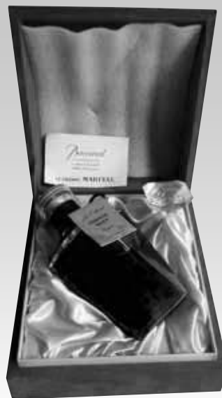
Lot 421 (COGNAC CORDON BLEU)