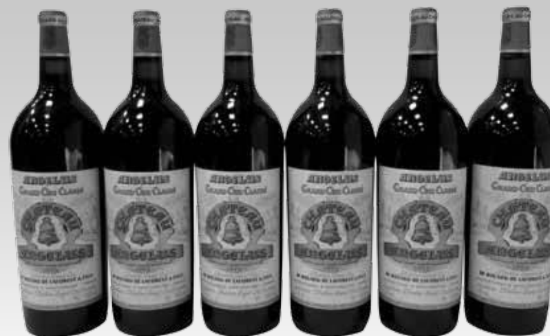
Lot 137 (6 MAGNUMS CHÂTEAU ANGELUS 1995)