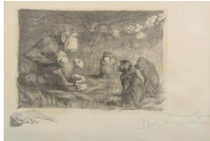
PAUL JOUVE (1878-1973) LE JUGEMENT DE PÂRIS OU FAMILLE SINGE. LITHOGRAPHIE. SIGNÉ ET DATÉ DANS LA PLANCHE P. JOUVE 97 AVEC ENVOI.