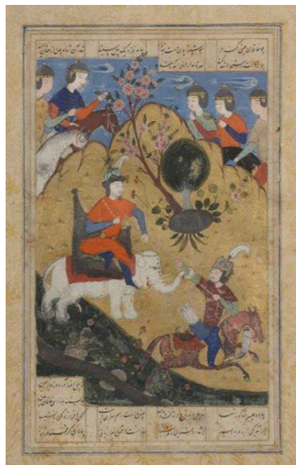
COMBAT DE RUSTAM ET DU KHAKAN DE CHINE ÉPISODE D'UN SHAHNAH DE FIRDAWSI, IRAN SAFAVIDE, SECONDE MOITIÉ DU XVI e SIÈCLE. GOUACHE SUR MINIATURE ENCADRÉE DE CINQ LIGNES EN ÉCRITURE NASTALI'Q À L'ENCRE NOIRE SUR QUATRE COLONNES. DIM. PAGE : 34 X 22 CM, DIM. MINIATURE : 23,5 X 14 CM