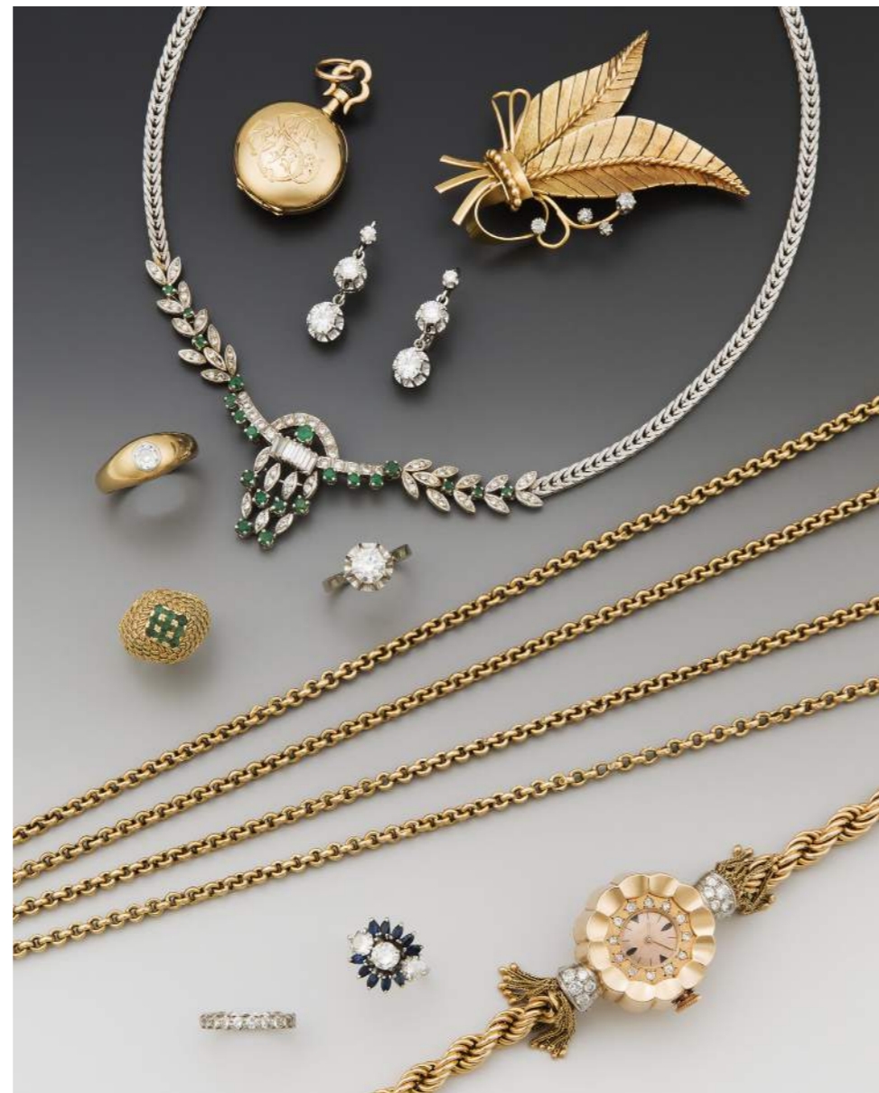
MONTRE DE COL EN OR 80/120 € — BROCHE EN OR ET DIAMANTS 250/350 € — PAIRE DE PENDANTS D'OREILLES EN OR GRIS ET DIAMANTS 4 500/6 000 € — COLLIER EN OR GRIS, DIAMANTS ET ÉMERAUTES 800/1 200 € — BAGUE JONC SOLITAIRE EN OR 200/300 € — BAGUE SOLITAIRE EN OR GRIS 1 200/1 500 €