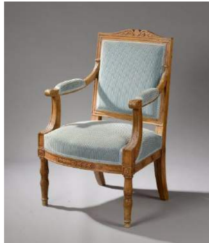
FAUTEUIL À FRONTON EN HÊTRE NATUREL DÉCAPÉ, MOULURÉ ET SCULPTÉ DE FLEURONS ET PALMETTES. MARQUES AU FEU: TROIS FLEURS DE LYS COURONNÉES DANS UN CERCLE ET MEU.

PROV.: LIVRÉ ENTRE 1810 ET 1811 PAR ALEXANDRE MAIGRET POUR L'AMEUBLEMENT DU PALAIS DE MEUDON. ÉPOQUE EMPIRE.