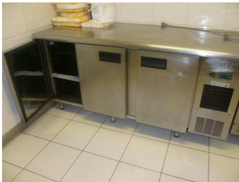
2 Tours réfrigérés en inox