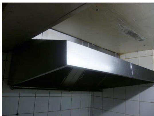
Hotte aspirante en inox à 2 filtres