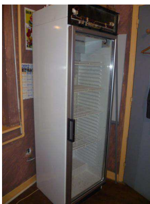
Armoire réfrigérée BEABY