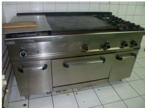
Piano de cuisson en inox au gaz bouteille MILANO - G9TP4F A 4 feux, 2 plaques, 1 four