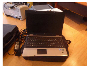
Ordinateur portable HEWLETT PACKARD