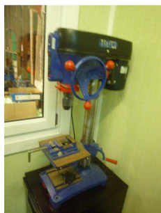
Perceuse sur colonne GENERAL DPL 16

Gaines fendues – manchons – Connecteurs – Bouchons – Coffrets anti-immersion – Grillage avertisseurs – Brouettes Taille-haies – manches – etc.