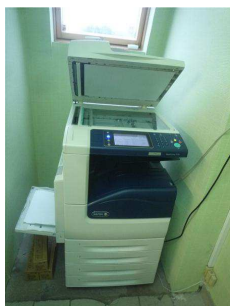
Photocopieur XEROX WORKCENTRE 7120