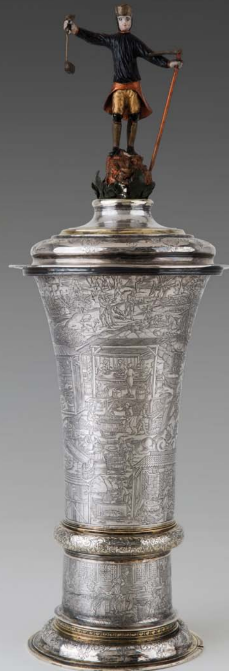
Hanap couvert en argent et vermeil Strasbourg