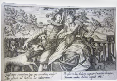
5 880 € Tempesta, Crispin de Passe – Le Clerc et Collaert. Album de 136 planches, début XVII e s.