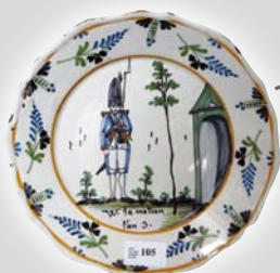
3 200 € Assiette, Faïence de Nevers. « Vive la nation l'AN III »