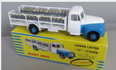
720 € Dinky Toys, Citroën P55 Laitier