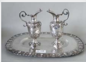
6 600 € Burettes en argent, Ancien Régime