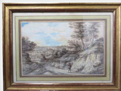
33 600 € Van Uden Lucas. Plume et encre brune, Lavis gris avec rehauts de gouache (18,5 x 29 cm)