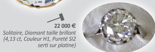
22 000 € Solitaire, Diamant taille brillant (4,13 ct, Couleur H1, Pureté SI2 serti sur platine)