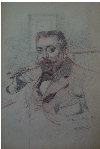
Bacquie-Fonade par FORTUNEY