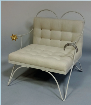
GAROUSTE & BONETTI : Paire de chauffeuses modèle « Jour - nuit ». 5 500 €