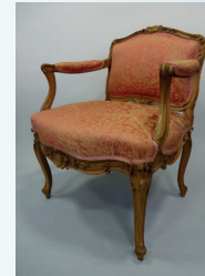
Fauteuil à dossier bas estampillé Tilliard. Epoque Louis XV. 5 500 €