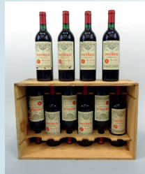
10 bouteilles Petrus, 1987. 10 750 €