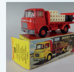
Dinky Toys : Camion brasseur Kronenburg. 4 300 €