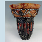
DAUM & MAJORELLE à Nancy. Vase cornet en verre marmoré et fer. H : 34 cm. 3 100 €