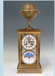
Pendule cage à complications. Signé E. Serin. Fin XIXe siècle. H : 54 cm. 9 560 €