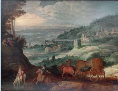
Joos de MOMPER et atelier de Sebastian VRANCX. Paysage avec Mercure et Argus et des cavaliers. Panneau. 58,5x74 cm. 10 500 €