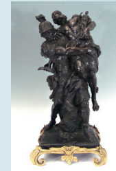
François GIRARDON : Enée et Anchise. Bronze. H : 60 cm. 6 090 €