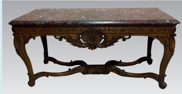
Table à gibier en chêne. Epoque Régence. 12 900 €