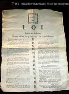
▽ 182. Placard révolutionnaire, loi sur les passeports.