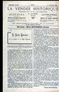
Δ 78. La Vendée historique, collection complète.