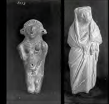
Δ 181. Série de plaques photographiques en verre montrant de nombreux artefacts antiques.