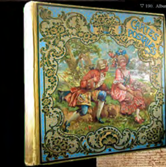
▽ 190. Album de cartes postales sur la Vendée.