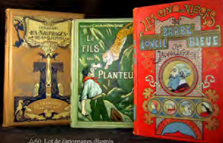
Δ 60. Lot de cartonnages illustrés.