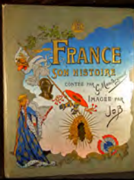
Δ 63. Illustrations de Job ▽ 13. Gilet illustré par Fontaines.