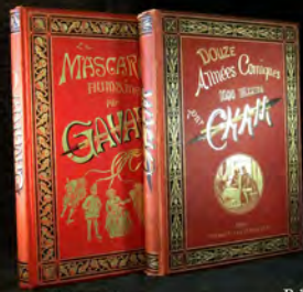
Δ 49. Ouvrari & Cham ▽ 64. Illustrations de Job.

Expositions : vendredi 13/06/2014 de 15h00 à 19h & samedi 14/06/2014 de 10h à 12h