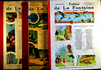
Δ 59. Fables de La Fontaine par Benjamin Rabier. ▽ 27 à 37. Plieuses liés sur la gastronomie & la cuisine.

Bel atlas portatif universel et militaire de Robert de Vaugondy, in-folio de 1748, réunissant 207 cartes colorées.