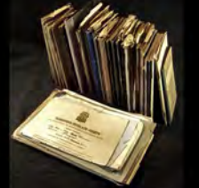
Δ 81. 48 carnets d'Henri Bourgeois.