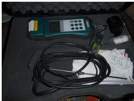
Analyseur de combustion KIMO