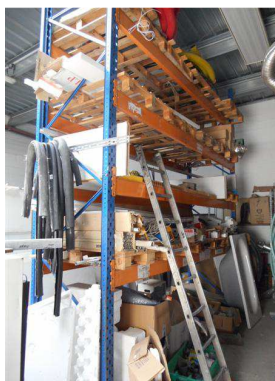
13m linéaire de racks métalliques H. 3,5menv.