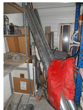
Stock de matériel de construction: Baignoires, Conduits inox, Eviers, Colliers de sertissage, etc...