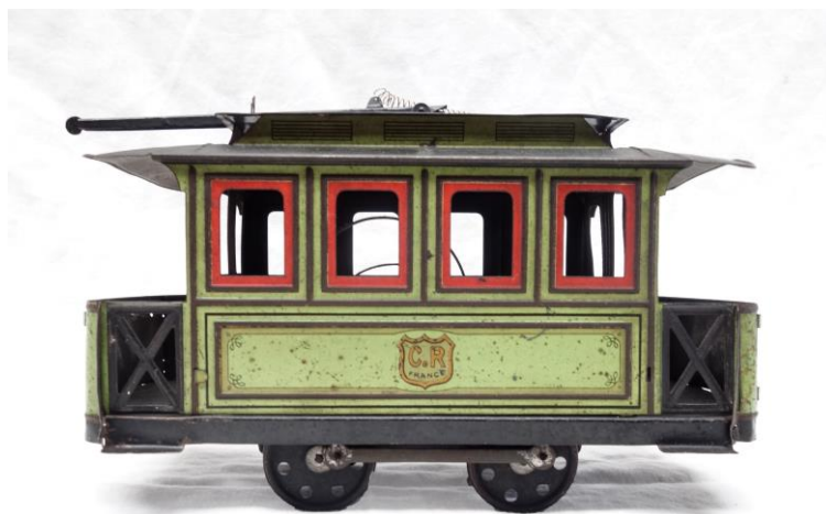
Lot n° 279

On y joint 1 SUSPENSION BILLARD DE STYLE TIFFANY , de forme trapézoïdale, en plastique coloré, H. : 22 cm, L. : 123 cm, P. : 45 cm